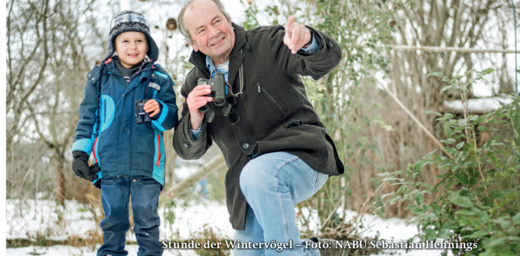
Stunde der Wintervogel – Foto: NABU Sebastian Herlings

Die Bundesgeschäftsstelle des NABU e.V. erhebt und verwendet Ihre hier angegebenen Daten für Vereinszwecke (z.B. Rückfragen, Einladungen) und gibt diese hier für auch an die für Sie zuständigen NABU-Gliederungen weiter. Ferner verwendet die Bundesgeschäftsstelle Ihre Anschrift und E-Mail-Adresse für weitere Informationen über Aktivitäten und Fördermöglich- keiten der für Sie zuständigen NABU-Gliederungen. Dieser werblichen Nutzung können Sie jederzeit widersprechen per E-Mail an service(at)NABU.de oder an die Anschrift der Bundesge- schäftsstelle. Generell erfolgt kein Verkauf Ihrer Daten an Dritte für Werbezwecke.