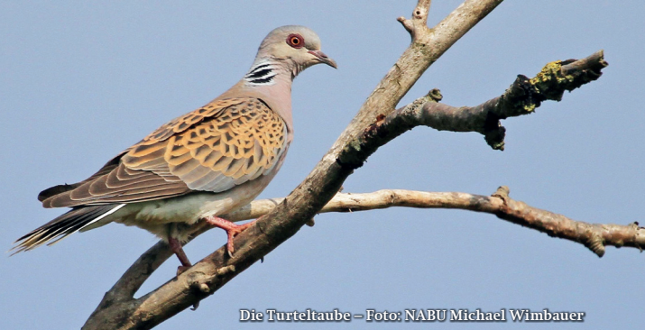
Die Turteltaube