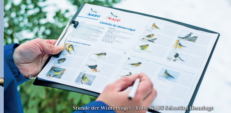
Stunde der Wintervögel