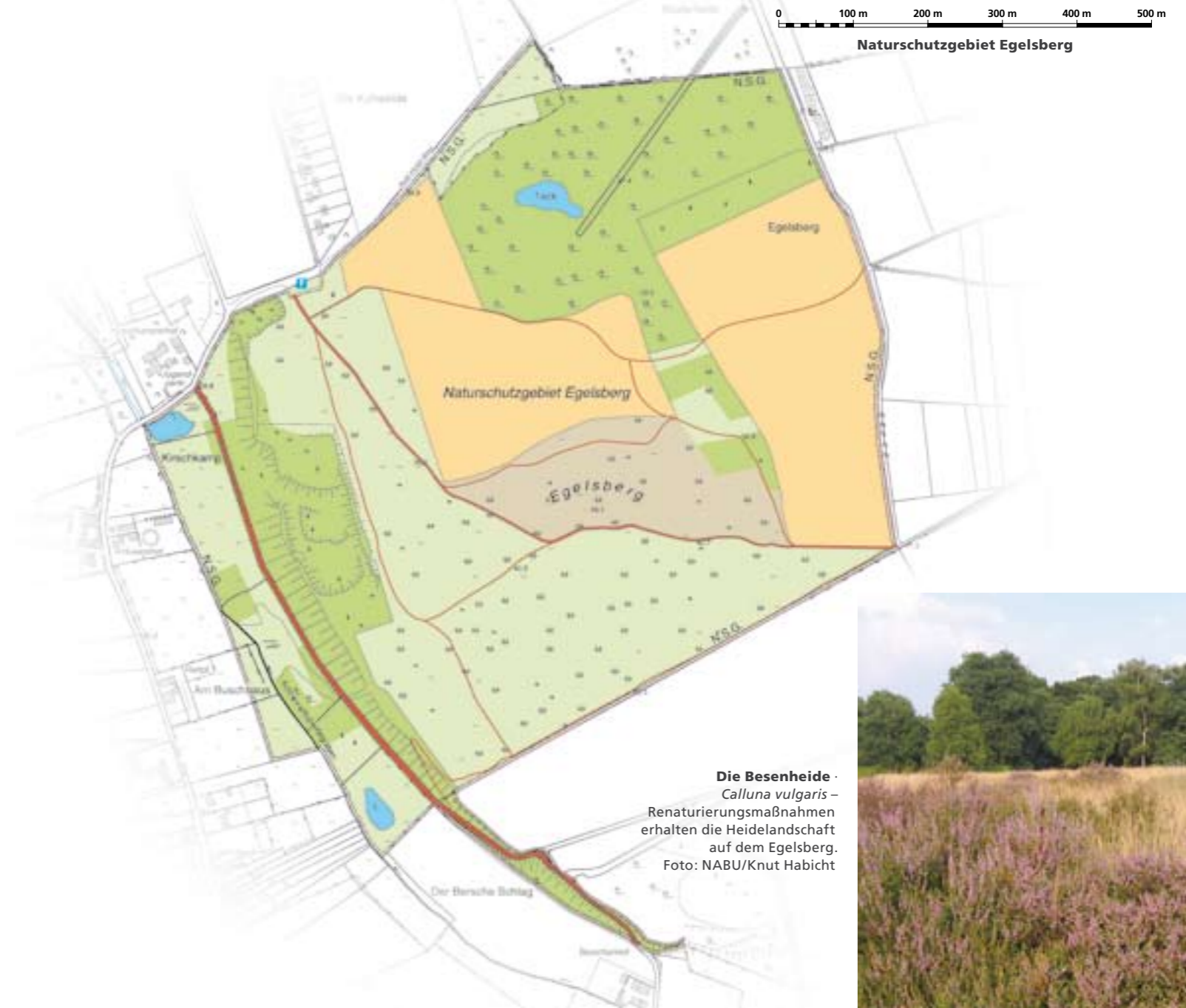
Die Besenheide · Calluna vulgaris – Renaturierungsmaßnahmen erhalten die Heidelandschaft auf dem Egelsberg.