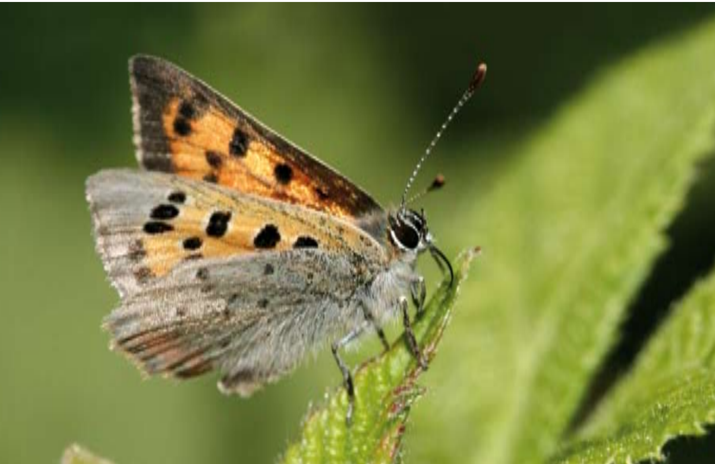
Der Kleine Feuerfalter · Lycaena phlaeas – dieser schöne Tagfalter ist auf den Heideflächen des Egelsbergs zu Hause.