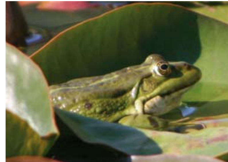
Der Teichfrosch · Rana esculenta – die Riethbenden im südlichen Bereich der Niepkuhlen bieten ihm einen optimalen Lebensraum.

0 100 m 200 m 300 m 400 m 500 m Naturschutzgebiet Riethbenden