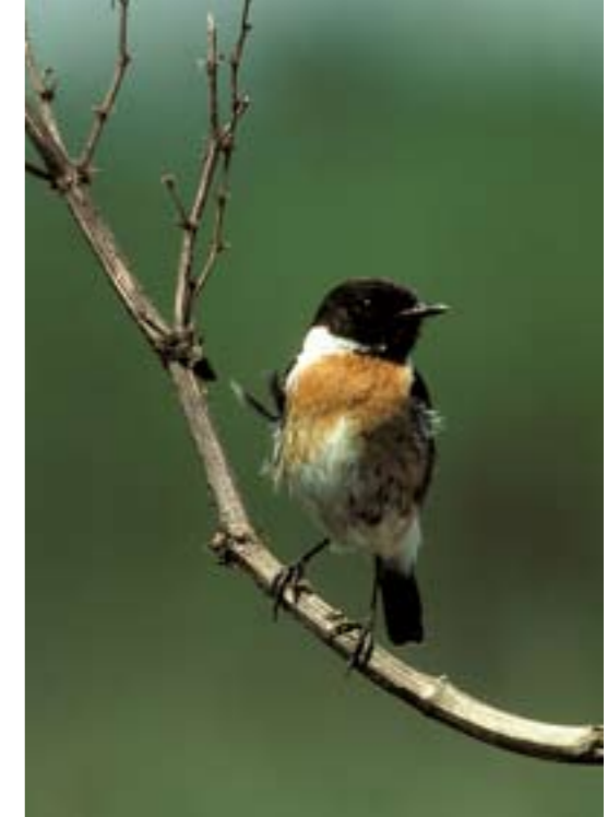
Das Schwarzkehlchen · Saxicola torquata – profitiert vom richtigen Naturmanagement auf dem Egelsberg und brütet hier wieder.

Es ist kein einfaches Thema, wenn es darum geht, was aus unserem Vermögen wird und wie wir unseren Nachlass regeln. Haben in früherer Zeit kinderlose Menschen ihr Vermögen häufig den Kirchen überlassen, so werden heute auch andere Stiftungszwecke bedacht. Zustiftungen in den Kapitalstock einer Stiftung wirken dauerhaft, da das Kapital in ungeschmälerter Höhe erhalten bleiben muss. Die Zinserträge wirken also quasi auf ewig für die Realisierung des Stiftungsziels, in unserem Fall der Erhaltung und Verbesserung der Natur unserer niederrheinischen Heimat – insbesondere für die kommenden Generationen. Ein schöner Gedanke, am Fundament Zukunft mitzuwirken, finden Sie nicht?