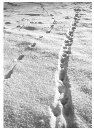
Wintertage mit Schnee sind ideal, um die Spuren vieler Säugetiere zu finden.

Wann, wo und wie lassen sich im Jahresverlauf unsere Säugetiere beobachten und welche Hinweise zu ihren Vorkommen gibt es?