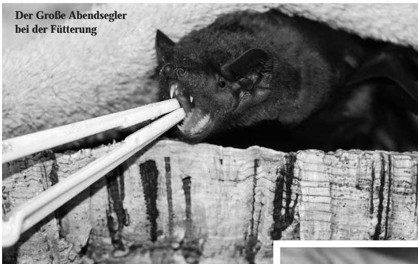
Der Große Abendsegler bei der Fütterung