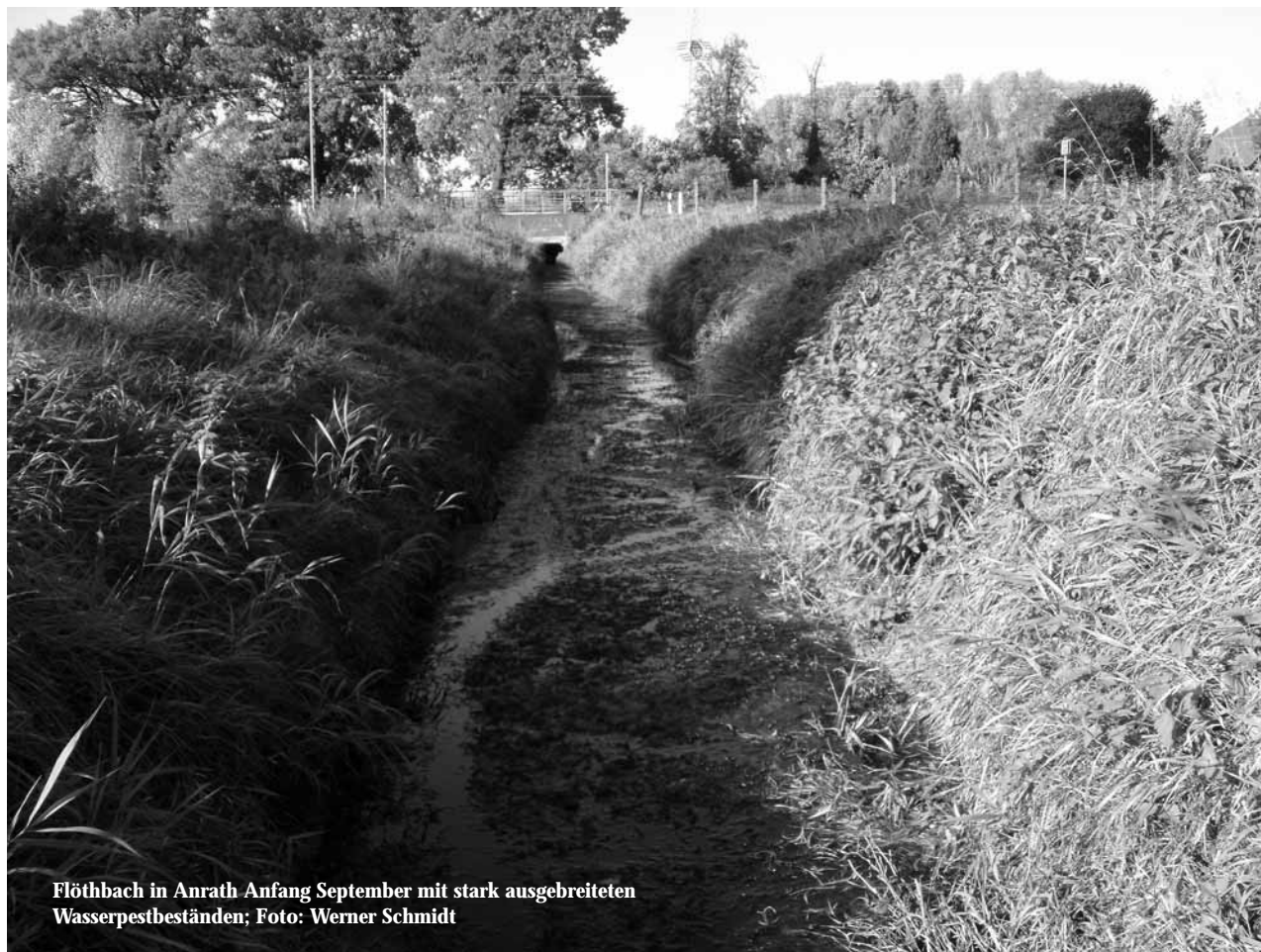
Flöthbach in Anrath Anfang September mit stark ausgebreiteten Wasserpestbeständen; Foto: Werner Schmidt