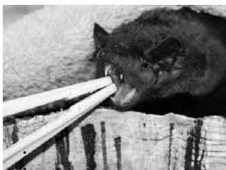
Urlaubsvertretung für die Fledermäuse