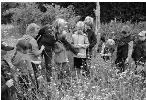
Auch Wildpflanzen bieten spannende Begegnungen.

Spielerische Wissensvermittlung macht großen Spaß!