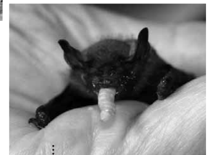
Die Zwergfledermaus mit Mehlwurm

Die Fütterung morgens und abends bewältigten wir gemeinsam. Dabei stellten wir schnell fest, dass die beiden sehr unterschiedliche Charaktere haben. Loki, der ältere Herr, hat ausgeprägte und sensible Eigenheiten, die das Alter so mit sich bringt. Er wollte nicht nur gefüttert, sondern auch bespaßt werden. Die Zwergfledermaus hat nur eins im Sinn: fressen, fressen, fressen. Nach den Mahlzeiten (man sollte jeweils eine Stunde einkalkulieren) sah der Tisch wie ein Schlachtfeld aus. Geköpfte Mehlwürmer und ausgesaugte Chitinpanzer landeten vor der Küchentür auf dem Rasen. Dort wartete regelmäßig eine einbeinige Bachstelze auf die Reste.