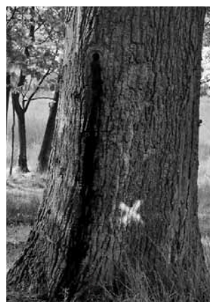
Ein markierter Fledermaushöhlenbaum

Meldungen an: Markus Heines, Steegerstraße 10 in 41334 Nettetal, Telefon (02153) 8121 oder markus.heines@web.de