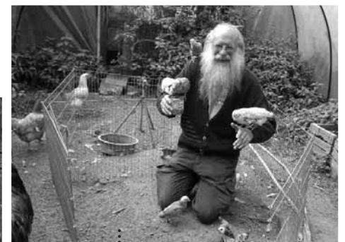
Die tägliche Hühnerfütterung