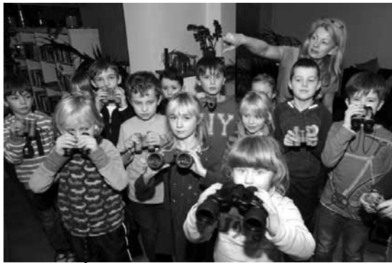
Kiddies zählen begeistert Piepmätze.