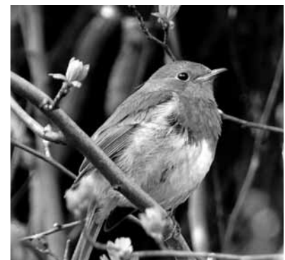
Ein Rotkehlchen besichtigt die neue Hecke.

Auf dem naturnahen Gelände des Freilichtmuseums mit seinen Obstwiesen, Gärten und Weiden finden sich auch an anderer Stelle traditionelle und typisch niederrheinische Arten wie