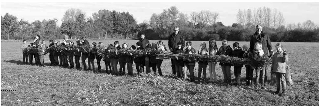
Stolz präsentieren die Kinder die Reisig-Faschinen.

„Das war eine tolle Aktion“, resümiert Organisator Rolf Brandt vom NABU zum Abschluss des Vormittags und dankte dem Wasser- und Bodenverband für die Unterstützung und sein außergewöhnliches naturpädagogisches Engagement. Lehrerin Irene Beurskens ergänzt: „Die Aktion war wirklich super vorbereitet. Den Kindern hat es riesig Spaß gemacht, und sie haben eine Menge gelernt.“ Für Anfang 2016 plant der Wasser- und Bodenverband die Renaturierung des