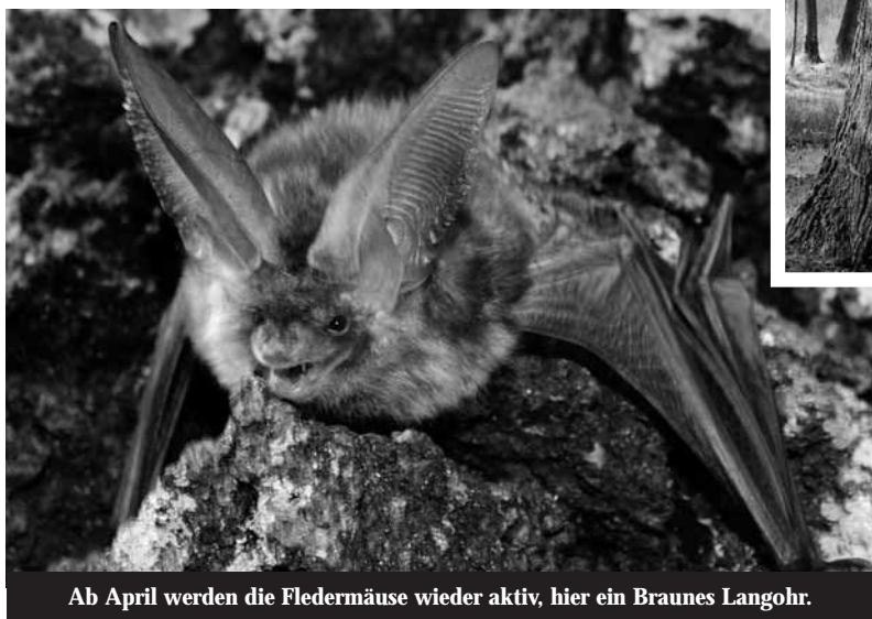
Ab April werden die Fledermäuse wieder aktiv, hier ein Braunes Langohr.

Auch suchen wir immer noch Säugetiermeldungen für den Kreis Viersen. Wer macht das erste Belegfoto der Haselmaus, wem läuft die heimische Wildkatze über den Weg? Wo schwimmt der Fischotter? Das wären schon echte Knaller! Belegfoto nicht vergessen!