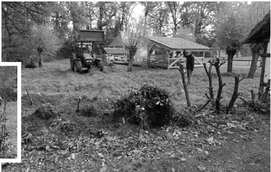
NABU-Pflegetrupp beseitigt den Kirschlorbeer.

Heimische Gehölze sind Teil der historischen Kulturlandschaft des Niederrheins und ein wichtiger Baustein des Natur- und Landschaftsschutzes. Der NABU Grefrath ersetzte im November in Zusammenarbeit mit dem Museumsverein und mit zusätzlicher finanzieller Unterstützung der Krefelder Stiftung „Natur- und Kulturlandschaften“ die Kirschlorbeerhecke an der Hofanlage Hagen durch traditionelle Hainbuchen.