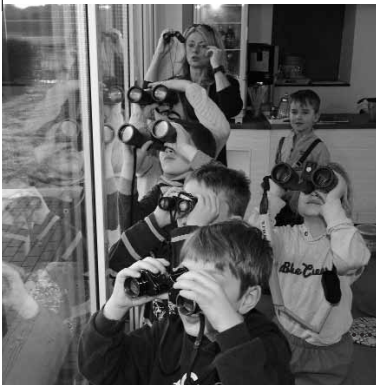
Am Hof Emschermündung wurden die Kinder gut vorbereitet.