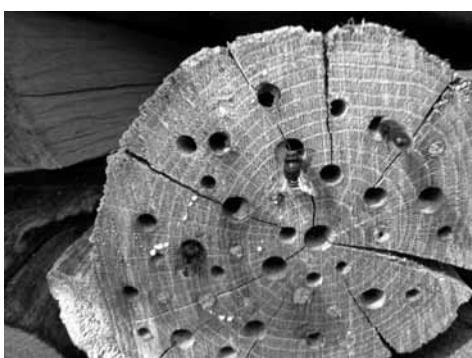
Einfache Insektenhölzer zum Selbstbauen