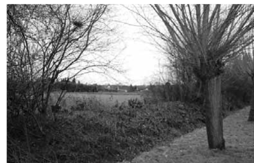
..... : : : : : Einer der fünf auf den Stock gesetzten Pflegeabschnitte