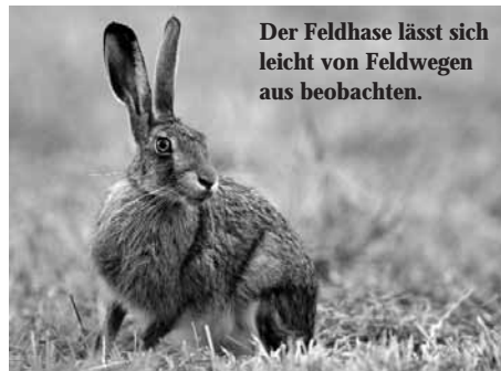
Der Feldhase lässt sich leicht von Feldwegen aus beobachten.

Im Januar und Februar , wenn es geschneit hat, lohnt es sich, in der Früh loszuwandern, um nach Spuren zu suchen. Trotz dieser kalten Jahreszeit sind einige Arten recht aktiv. Reh, Wildschwein, einige Marderartige und der Rotfuchs sind unterwegs. Wenn der Abdruck deutlich genug ist, sind bei den Mardern ihre fünf Zehen im Schnee zu sehen. Eine Rotfuchsspur ähnelt sehr einer Hundspur, sie ist aber länglicher und ovaler. Die beiden vorderen Zehen stehen weiter nach vorne ab. Die zum Schalenwild gehörenden Rehe und Wildschweine hinterlassen ebenfalls typische Spuren: zwei kleine Halbschalen beim Reh, größere beim Wildschwein. Beim letzteren sind oft noch am unteren Rand die deutlich seitlich abstehenden beiden Afterklauenabdrücke zu erkennen. Diese Unterscheidung bezieht sich natürlich auf