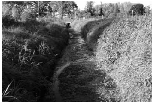
Stickstoff im Überfluss – ein Problem für unsere Gewässer

Nächster Redaktionsschluss für Heft 3/2016: 15. April für Heft 4/2016: 15. Juli